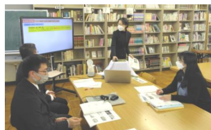
【↑ 教育活動の充実について、道外視察の成果を発表する本校職員】

3学期においても、教育委員会や各関係機関、コミュニティ・スクールを通じた外部人材等と十分連携の上、スキー授業や卒業式等の各種教育活動の実施に、その時々状況に応じた最善の体制で臨んでまいります。また、タイトルに示したとおり、