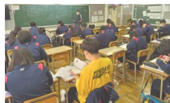
【↑ (3A) 進路実現に向け、集中して学習する3年生 ↓ (3B)】

と信じて、「今やるべきこと」「やってみたいこと」に没頭したり、自分のよさや可能性を伸ばしたりするとともに、 苦手なことの克服にもチャレンジしていきましょう！