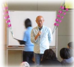
【長尾 PTA 会長の挨拶】