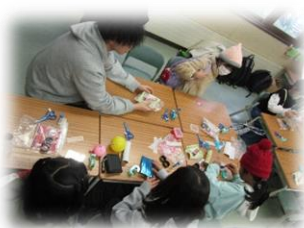
【万華鏡づくり（職能大）】