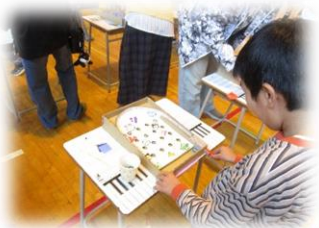
【スマートボール（5年生）】