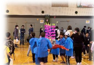
【祭りだ！ わっしょい！】