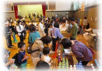
【PTA 事務局のお店也大忙し！】