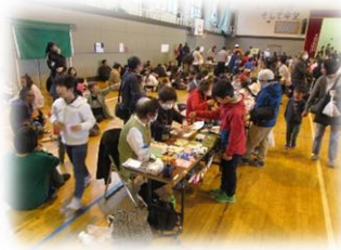
【銭函元気会のお店也大盛況！】