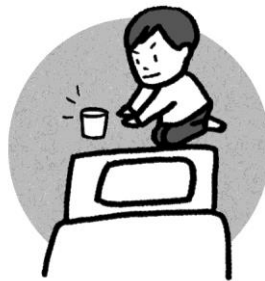
容器を枕元に置いて寝る