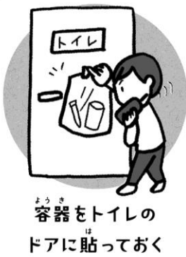
容器をトイレのドアに貼っておく