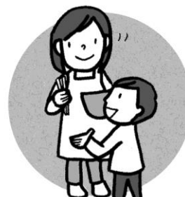
家族の人に話しておく