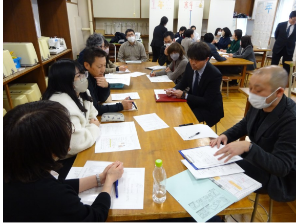
小中の教職員が同じ課題に向き合う

1月18日(木)小中連携合同会議を本校で行いました。授業参観を終えた後、教育課程部会・学力体力向上部会・生徒指導部会の3部会で行った研修会では、今年度の振り返りと次年度の課題について話し合いました。①潮見台地区の子どもたちの良さと課題 ②良さを活かし伸ばす活動 ③課題解決への手当て、等について話し合いました。ルール・規律を守ることができる潮見台地区の子どもたちの良さを活かし、目指す子ども像の具現化を図るためにどのようなことができるだろうか・・・と話しは尽きず、実りある研修会となりました。