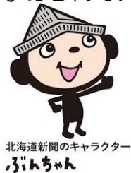
北海道新聞のキャラクター ふんちゃん

しかし、持続可能な社会の担い手として期待される子供達に求められる力は、教科の教材に沿って「2011年の東日本大震災の被害状況と復興はどうなっている」という知識やデータを読み取る力や、「難民を助けるための行動」について考察する力にとどまりません。1月1日に発生した「能登半島地震」に対して、自分ごととして考え、備えたり支援したりとリアルタイムで情報をとらえ行動につなぐ力が求められているのです。