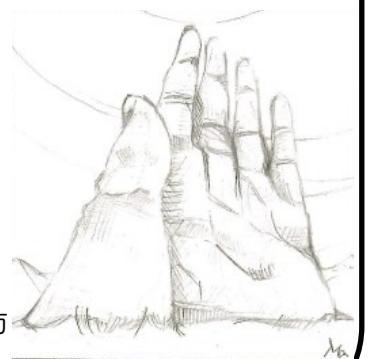
画: 沢木 真理子