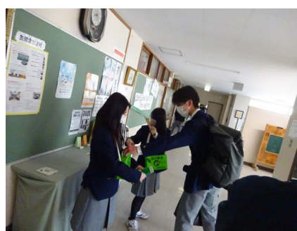
募金を呼びかける生徒会役員

全校生徒のために、考え、動き、働く生徒会。生徒会スローガンは「キッチン」。「コロナウイルス感染症による制限がなくなった潮見台中学校を新しく創っていきたい」「新しいことに挑戦し、素敵な学校生活を送ろう」という全校生徒へのメッセージが込められています。今月の活動は、地域清掃を行ったほか、「緑の羽根募金」を行いました。多くの『善意』が寄せられました。生徒会役員の皆さん、協力してくれた全校生徒の皆さんありがとうございます。