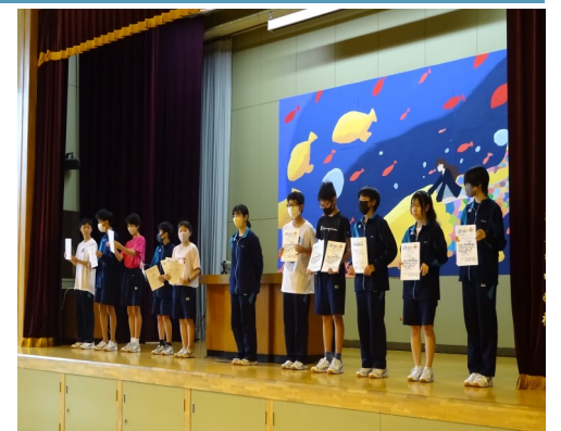
互いの健闘をたたえあう仲間たち

中体連結果報告会を終えました。4年ぶりに全校生徒が一斉に集う中での実施となりました。3年生は3年間部活動にかけた思いを後輩に伝え、1、2年生の選手も来年の大会にかける決意を全校生徒に伝えました。3年生の活躍、思いやりを胸に、後輩の皆さんは、1年後の中体連を目指し努力を重ねていけたらいいですね。