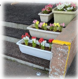
玄関前の花も嬉しそう

変化の激しいこれからの社会を生きる子ども達には、未来に向けて自らが社会の創り手となるために資質・能力を育成していくことが求められています。そのためには、教科で学ぶ基礎的・基本的知識や技能の確実な定着に加え、未知の状況にも対応できる思考力・判断力・表現力の育成、そして何より自ら学びに向かい、よりよい生活や人間関係を自主的につくりあげる態度を、教科横断的に育成していく必要があります。そのような観点で、4月からの子供達の学びの姿を振り返ると、行事の成功で得た達成感を日常の活動に活かし、楽しみながら人とのつながりを深める姿にたくましさ頼もしさを感じます。