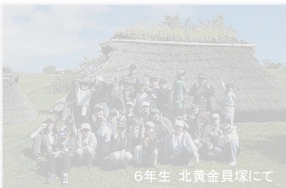
6年生 北黄金貝塚にて

6年生は修学旅行でウポポイ、北黄金貝塚、有珠山等を見学しました。5年生は天狗山おこばち山荘で宿泊学習を行いました。どちらの学年も天候に恵まれ、気持ちよく野外活動を行うことができました。