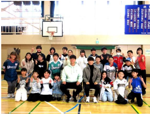
↑ 6年生との集合写真

いただいた記念品のサインボールは職員室前に展示しておりますので、ご来校の際は是非ご覧になって下さい。