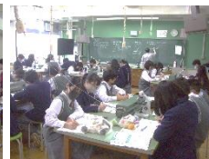
〈2年生の理科の様子〉