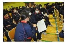
〈生徒会企画の様子〉