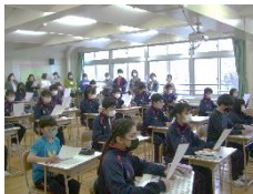
〈1年生の音楽の様子〉

去る4月21日(金)、本年度最初の授業参観が行われました。学校における新型コロナの対応が緩和されたこともあり、多くの保護者の方々が来校し、生徒の学習の様子を見ていただきました。新学期ということもあり、より張り切って、挙手する様子や、大きな声で校歌を歌う様子が見られました。今後もこのような機会を大切にしていまいりますので、多くの機会にご来校ください。