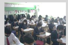
〈調査に取り組む3年生の様子〉

4月18日(火)、標記調査が終了しました。新学習指導要領全面实施3年目を迎え、「主体的・対話的で深い学び」の実現に向け、本結果をもとに今後も、更なる指導の充実を図ってまいります。なお、生徒質問紙調査と英語の「話すこと」調査については、5月8日(月)オンラインで実施されます。