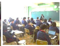
〈3年生の英語の様子〉