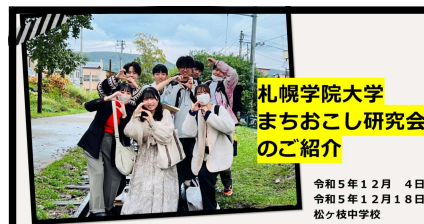
札幌学院大学 まちおこし研究会 のご紹介

今後は、冬休みの学習会や国際スポーツ雪かき選手権でも交流のチャンスがあるので、ぜひ参加してさらに親交を深めてください。