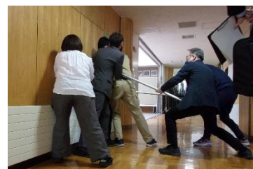
先生方で不審者対応をしていました

5月18日(月)に、「児童が自ら、及び他者の安全確保のための行動について主体的に考えるとともに、児童の安全を確保し、確実に保護者へ引き渡す。」ことを目標として今年度も訓練を実施しました。学校で不審者が侵入した時に大切なことは、「おしゃべりをしない」「先生の指示を聞くこと」「落ち着いて行動すること」です。警察の方からの講評や今回の訓練の様子から、子どもたちの防犯への意識が確実に高まった留め置き訓練となりました。保護者の皆様もご協力ありがとうございました。