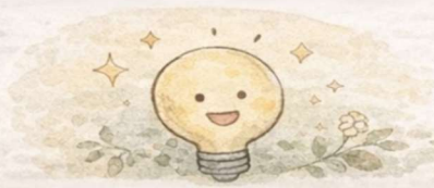
気持ちのコントロール