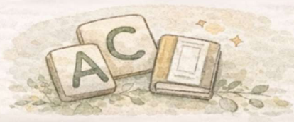
自分に合った学び方