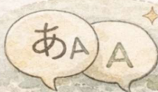
言葉・コミュニケーション