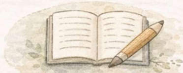
読み書き・計算の基礎