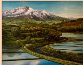
「春風」(福原幸喜教諭作)