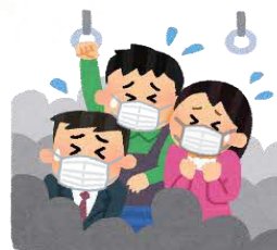
混雑した乗り物の中