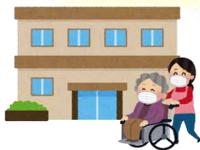
高齢者施設など に行くとき