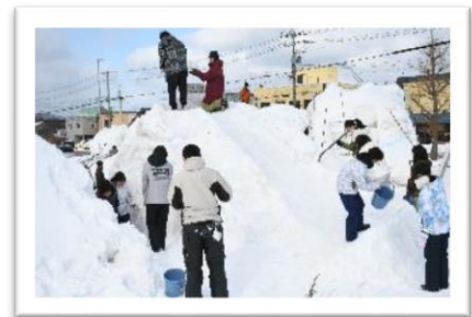
【昨年度の雪像づくりの様子】

例年、本校生徒会も雪像づくりを通して地域の行事に参加させていただいておりましたが、新型コロナウイルスを封じこみ、晴れて開催の際には、改めて参加をさせていただきたいと思っております。