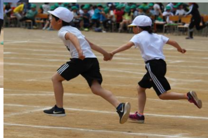
#4年生#相棒と協力して#最後まであきらめない!!#後ろで応援#掛け声も大事#UFOキャッチ