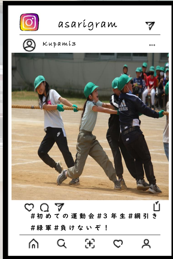
#初めての運動会#3年生#綱引き #緑軍#負けないぞ！