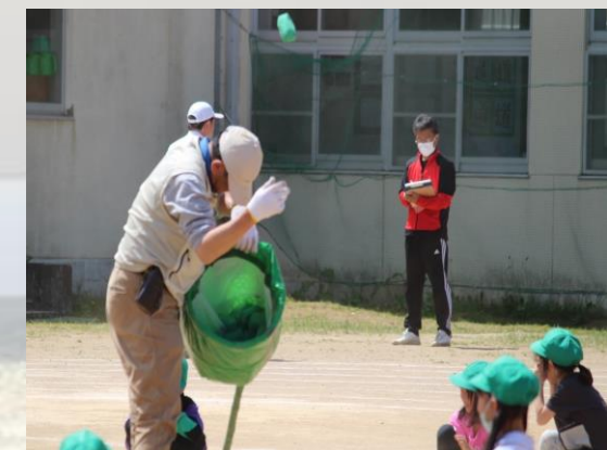
#いーち#にー#さーん#赤軍は まだあるかな？#黄色軍は？