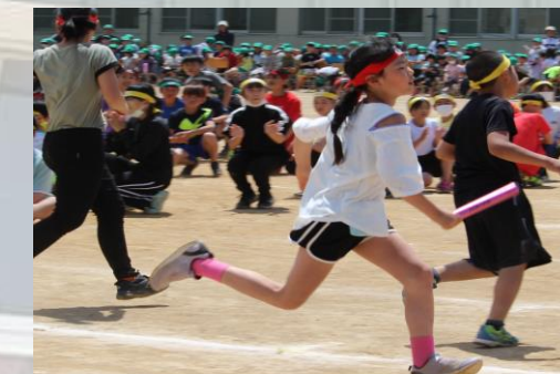
#運動会の花形#高学年リレー#走順も各チームで話し合い#足もしっかり合わせて#かっこいいバトンパス#120mを駆け抜ける姿#圧巻