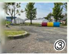
バイビュータウン中央公園

通称:特になし 国道5号線にある 「加工 工房」の裏手 しましまのトンネルがある 盆踊りを行われる事も