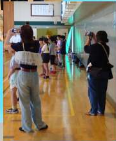
PTA広報誌 作り方講習会