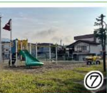
朝里小前の市営団地の公園

通称:特になし 学校医すみえ医院の裏手にあり 秋には沢山の松ぼっくりが取れる 遊具下が砂の為小さい子も安心