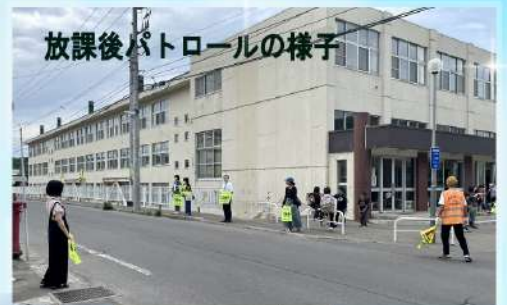
放課後パトロールの様子