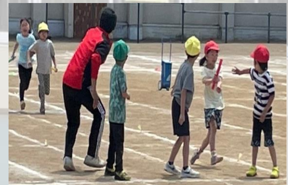
#低学年リレー#バトンをしっ かり次の人へ#3年生が1・2年 生のお手本に#チームをまとめ ます#緑軍#赤軍#黄色軍#応援 も最高潮!!