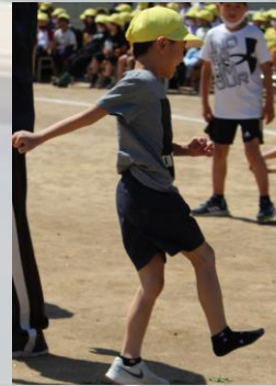
#いちについてよーいドン！ #徒競走#靴が脱げても #全力でゴールを目指す