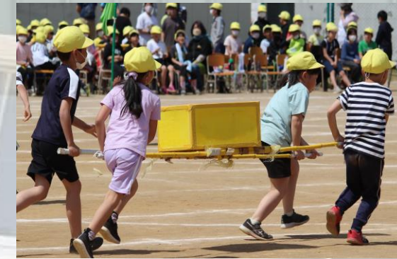
#朝里宅急便#早く行き過ぎ ないで～#うまく運べたよ #次の人へバトンタッチ