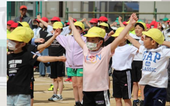
#ラジオ体操#体をしっかり 動かして#ケガ防止