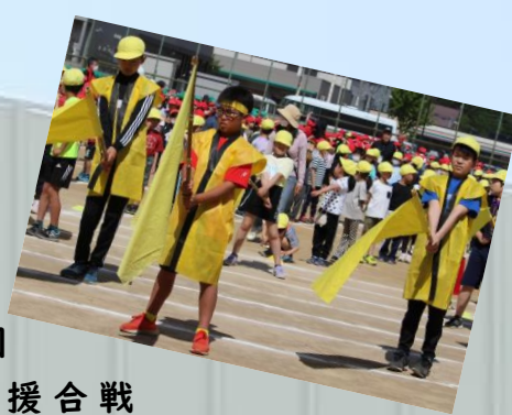
#緑軍#赤軍#黄色軍#応援団 #一生懸命考えた個性光る応援合戦 #優勝目指すぞ！#おー！