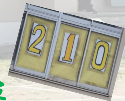
優勝 赤軍 緑軍 黄色軍 も大健闘